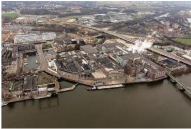
Luchtfoto Sappi – Landbouwbelang