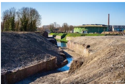
Groene Gashouder en vrijgraven vestingwerken

Vanaf 2018 zijn wandel- en fietspaden verbindingen gerealiseerd tussen Sphinxterrein, Bosscherweg en Frontenpark. Rond de zomer volgt de oplevering in het kader van het Noorderbrugproject. Daardoor ontstaat pal tegen de oude binnenstad een aaneengesloten park van bijna 20 ha dat voor de bewoners goed bereikbaar is. Nu deze opgave is volbracht, is de gedachte om het park meer beleefbaar te maken. Samen met belangenorganisaties, onder andere Stichting Maastricht Vestingstad, wordt nagedacht over de wijze waarop cultuurhistorie en natuur beter voor het voetlicht kunnen worden gebracht.