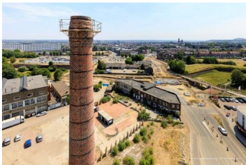
Schoorsteen en binnenterrein Radium

Ten zuiden van het nieuwe tracé van de Noorderbrug ontstaat een gebied met interessante gebouwen als de Radiumschoorsteen, industriële gebouwen als de Gasfabriek, het Kunstfront, het LAB-gebouw en de groene Gashouder. Op het Radiumterrein en de stadswaai is er tevens ruimte voor buitenrecreatie en activiteiten. Dit deelgebied wordt fasegewijs met tijdelijke en definitieve functies ingevuld en er is ruimte om te experimenteren. De ontwikkeling past binnen de vastgestelde ambities van Belvédère in 'Het Antwoord van de Sphinx'.