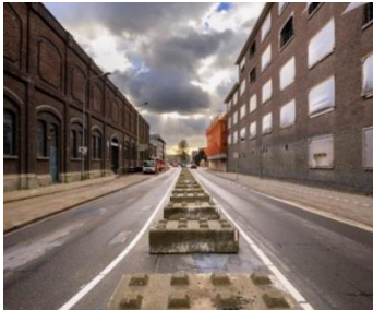
Reservering tramtracé Boschstraat

In het kader van het voorliggend raadsvoorstel rapportage stand van zaken Belvédère inclusief grex 2019 wordt voor het volledige overzicht van de gebiedsontwikkeling de stand van zaken met betrekking tot het tramdossier op hoofdlijnen meegenomen. Rapportages over het tramdossier vinden plaats op de in het vastgestelde projectplan beschreven wijze.