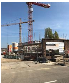
CPO in aanbouw

Op initiatief van uw raad is ruimte gegeven aan enkele initiatieven voor CPO waarbij aspirant-kopers zich in een vereniging organiseren en zelf de planontwikkeling en uitvoering aansturen. Inmiddels zijn er drie CPO's: Les Mouleurs (20 appartementen), SphinxTuin (28 appartementen) en daarvan afgesplitst Parkwoningen (5 grondgebonden woningen). De eerste twee hebben van de WOM grond gekocht en zijn gestart met de bouw. De CPO Parkwoningen zal naar verwachting medio 2019 met de uitvoering starten om ongeveer tegelijk met de anderen klaar te zijn. Een uitdaging voor de CPO's is nog de gezamenlijke inrichting en het beheer van de gemeenschappelijke binnentuin. Zoals eerder aangekondigd zal er een gezamenlijke evaluatie plaats vinden om de leerpunten vast te leggen waarvan bij nieuwe CPO-initiatieven gebruik kan worden gemaakt. Deze evaluatie zal met uw raad worden gedeeld in de context van de beleidsevaluatie met betrekking tot particulier opdrachtgeverschap.