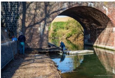
Aanleg wandelpad lage Fronten

wordt geschikt gemaakt voor mindervaliden in het kader van het tramdossier. Er is ook een nieuwe wandelroute gemaakt vanaf het Bassin beneden langs het water door de Lage Fronten en via de onderdoorgang Cabergerweg naar de Hoge Fronten. Deze wandelroute eindigt in de Hoge Fronten bij een (nog te realiseren) trap. Deze meer avontuurlijke wandelroute is uitgevoerd als zogenaamd 'struinp pad'. Een prachtige circa 2 kilometer lange 'struinaroute' door de natuur met beleving van de oude vestingwerken.