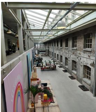
Loods 5: de lichtstraat

Het retailgedeelte is geopend vanaf maart 2019.